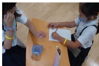
クラスや学年の垣根を越えて 遊びに夢中

※プログラミング教室等定員のあるプログラムで参加希望者が多数の場合は、参加したことがない児童を優先するため、次回以降の参加となる場合があります。