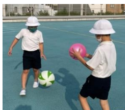
屋上の校庭で元気いっぱい！