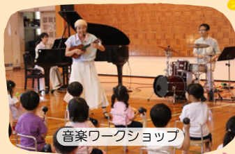
音楽ワークショップ