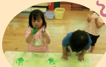
絵の具でお絵描き