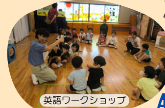
英語ワークショップ