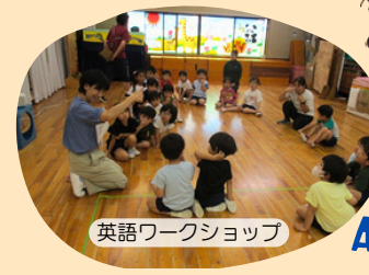
英語ワークショップ