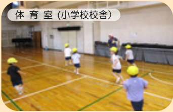
体育室(小学校校舎)