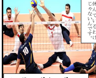
シッティングバレーボール じ休んでいるわけじゃないんですわ