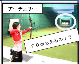
アーチェリー 70mもあるの!?