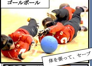
ゴールボール 体を張って、セーブ!!