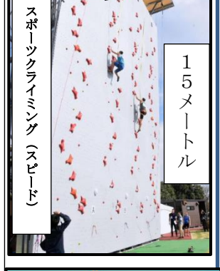
スポーツクライミング(スピード) 15メートル