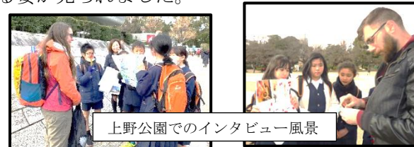
上野公園でのインタビュー風景

6年生は、この日を迎えるにあたり、上野公園へ行き、外国の方々に日本に関するインタビューを行いました。そこで、外国の方々が日本の文化に興味のあるものは何か、好きなものは何か等を知りました。自分たちの予想外の回答があって驚いたり、英語を使つてのインタビューにドキドキしながらも、話が通じたことにうれしさを感じたりする姿が見られました。