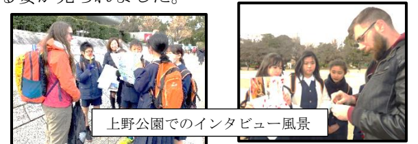
上野公園でのインタビュー風景

6年生は、この日を迎えるにあたり、上野公園へ行き、外国の方々に日本に関するインタビューを行いました。そこで、外国の方々が日本の文化に興味のあるものは何か、好きなものは何か等を知りました。自分たちの予想外の回答があつて驚いたり、英語を使つてのインタビューにドキドキしながらも、話が通じたことにうれしさを感じたりする姿が見られました。