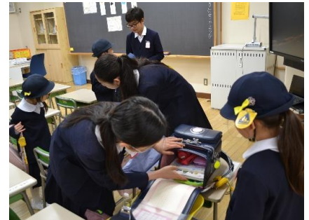
1年生のお世話をする6年生

1年生は、もうすっかり根岸小学校の子供として学校生活を送っています。気持ちよくあいさつをしたり、授業中はまっすぐに手を挙げて発言したりする姿も見られ、たいへん立派です。2年生は、何といても入学式でのアトラクションが素晴らしかったです。呼びかけも立派で、「喜びの歌」の合奏は圧巻でした。3年生は、初めてのクラス替えて、担任の先生も変わり緊張のスタートでした。社会、理科、総合、外国語活動など、新しい学習も始まり、胸をわくわくさせながら積極的に頑張っています。本校では、高学年において教科担任制を行っていますが、4年生も一部の教科で教科担任制を取り入れています。担任の先生以外にも学年の先生に教わる機会があり楽しく学習を進めています。また、これから始まるクラブ活動も楽しみの一つです。5年生は、高学年の仲間入りをし委員会活動が始まりました。「学校全体のために」という思いで仕事につくことに誇りを感じています。素晴らしいことです。そして、何といても6年生の活躍は素晴らしいです。1年生が安心して学校生活を送ることができるように、登校時や根岸活動の時間などに1年生の教室に行き、一つ一つ優しく教えてあげる姿が見られます。また、委員会活動やクラブ活動、縦割り班活動などではリーダーシップを発揮し、運動会や1年生を迎える会などの各種行事では中心的な役割を担うとともに、裏方としてもしっかり支えてくれます。一か月前はまだ5年生だった子供たちが、今では、すっかり頼もしい6年生に変身しています。各学年とも、それぞれのめあてに向かって力強く歩み始めました。保護者や地域の皆様におかれましては、子供たちへの励ましと応援をどうぞよろしくお願いいたします。