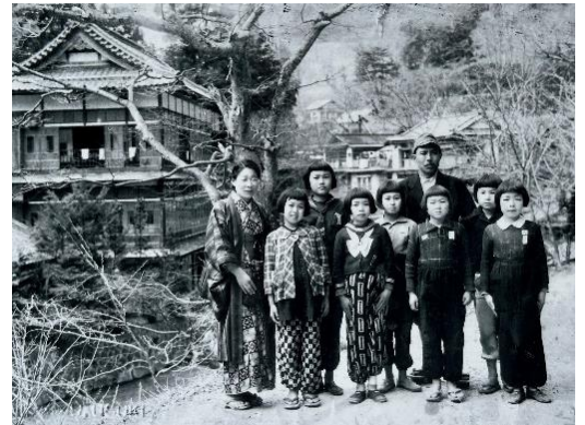
疎開中の子供たち（昭和20年4月・福島県東山）

出発の日、福島へは夜行列車で向かいました。上野駅で子供たちを乗せた列車を見送るために、家族や地域の人達が鶯谷駅の辺りに大勢集まりました。けれども、夜で見送りの人の顔は見えません。見送りの人はみな提灯を揺らして子供たちを送ったそうです。お父さんやお兄さんは、赤紙（召集令状）が来て戦争に行かなければならないかもしれない。空襲で家が焼けてしまうかもしれない。疎開して自分が助かったとしても、家族がみんな死んでしまったら、自分はどうやって生きていけばよいのだろうという大きな不安を10歳前後の子供たちに背負わせなければなりません。見送る方も見送られる方も今生の別れを覚悟しながらの出発でした。