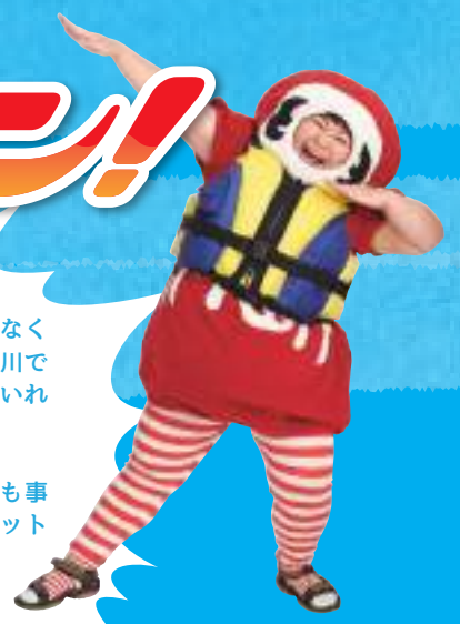
だるまキャラの「山田ま」ちゃんが、ライフジャケットを着て「川田るま」に変身!