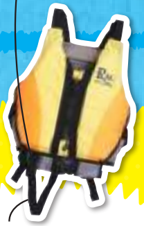
ライフジャケット・オン・スタイル

川は楽しい場所ですがリスクもあります。川に入らなくても川岸で足を滑らせて転落することもあります。川での水難事故のほとんどはライフジャケットさえ着ていれば防げた可能性があります。