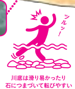
川底は滑り易かったり石につまづいて転びやすい