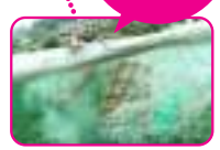
穏やかな流れに見えても… 急に深くなる! 滑りやすい!