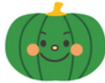
まんじろう 万次郎カボチャ

変わった形のかぼちゃで、ねっとりした食感のためポタージュやデザートにぴったりの品種です。12月には冬至かぼちゃとして使い、給食で提供します。