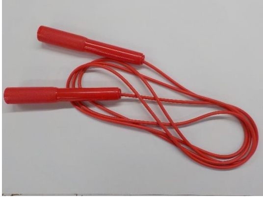
※ビニール素材のもの こちらのタイプを御用意ください。

縄素材のもの（写真右）は軽くて回しづらいため、御購入いただく際は、ビニール素材のもの（写真左）が好ましいです。色の指定はありません。