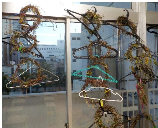
↑ 去年のリースの写真（イメージ）