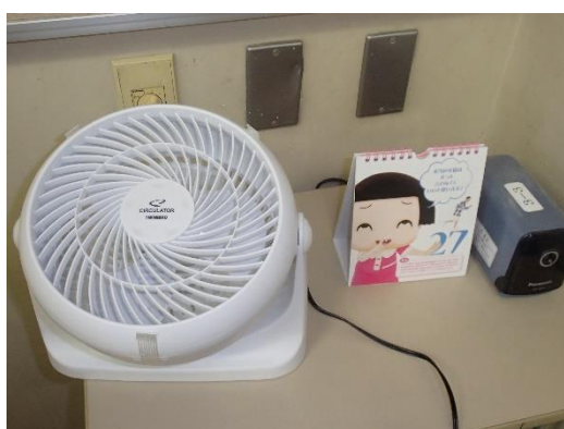
【サーキュレーター】

今後、5階の各教室の窓には可動式のルーバーを設置し、雨の日に窓を開けても雨が降りこまないよう対策を講じる予定です。