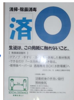
【消毒の実施・未実施が分かるよう各教室に掲示してあるパネル】