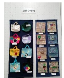
「昨年の展示の様子」