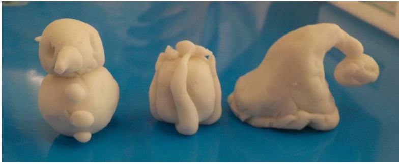
↑雪だるま、プレゼント、サンタの帽子