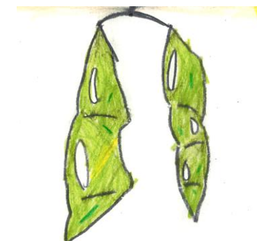
3年1組 ⇨ 〇〇さん