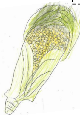
1ねん1くみ ⇨ 〇〇さん