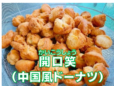
かいこうじょう 開口笑 (中国風ドーナツ)