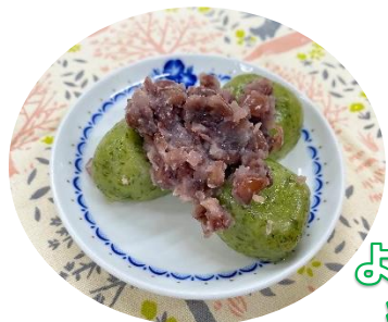
よもぎの展示も行いました。