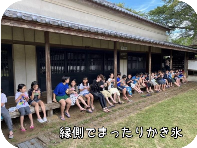
縁側でまったりかき氷

7月31日(月)～8月1日(火)に常総市宿泊校外学習がありました。「一人一人のCOLORを大切に、協力し、助け合う」ことをめあてに、子供たちと一緒に準備をしてきました。