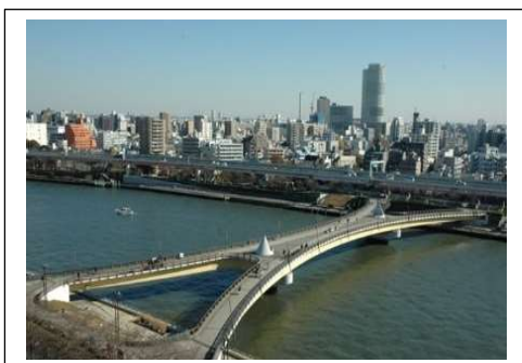
隅田川にかかる桜橋