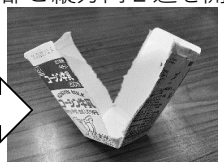
上部と縦方向2辺を開く