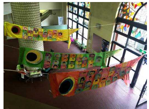
↑1年生が作った鯉のぼりが玄関に飾られています